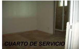
CUARTO DE SERVICIO