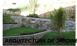
ARQUITECTURA DE JARDINES