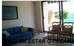
SALA DE ESTAR O RECAMARA