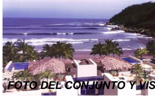
FOTO DEL CONJUNTO Y VISTA