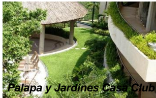
Palapa y Jardines Casa Club