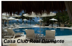
Casa Club Real Diamante