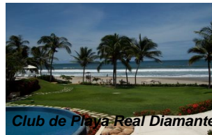
Club de Playa Real Diamante