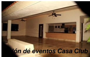
Salón de eventos Casa Club