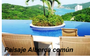
Paisaje Alberca común