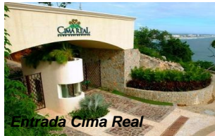
Entrada Cima Real