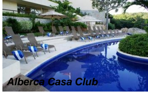
Alberca Casa Club